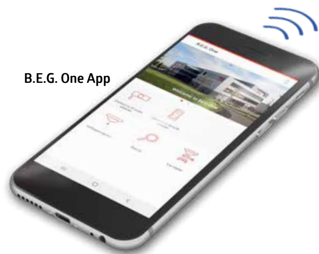
B.E.G. One App

Téléchargez l'application de contrôle à distance gratuitement !