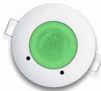
Bonne qualité de l'air

L'appareil offre également la possibilité de signaler le dépassement de la valeur limite au moyen d'un signal sonore et d'un contact de relais.